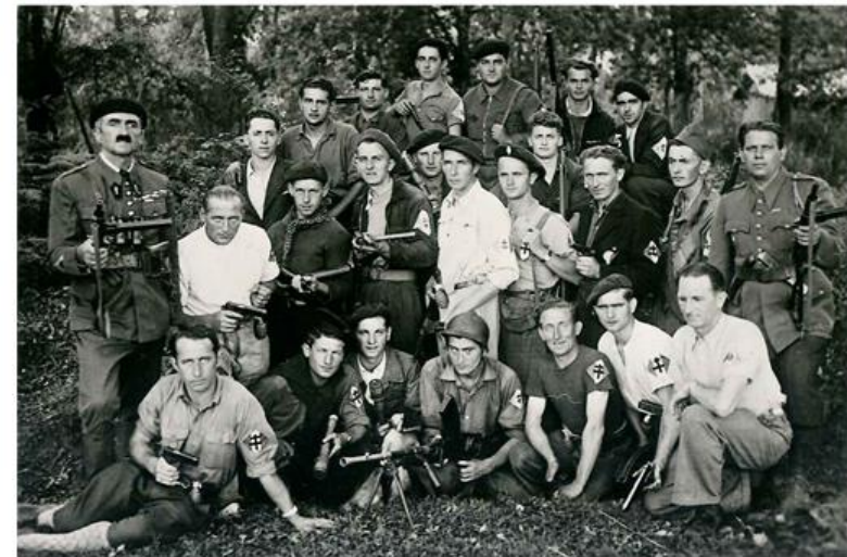
Résistants Grenadois en 1944