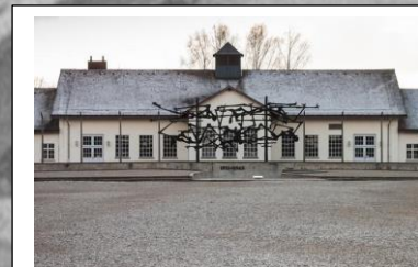
Camp de Dachau