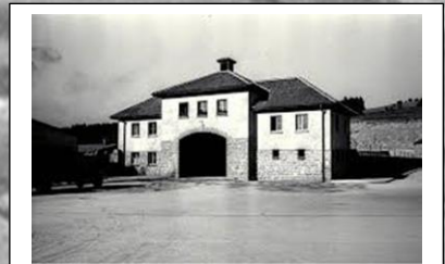
Camp de Güssen (Mauthausen)